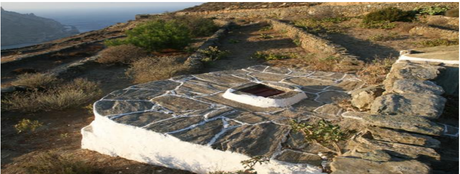
Ritratt 2. Folegandros Island, (ritratt: Ilias Nokas)

a) It-tnaqqis u d-degradazzjoni tal-abitati naturali jew żoni kulturali importanti, b) aċċess limitat lejn il-kosti, c) tibdil permanenti tal-forma tal-kosti, d) tnaqqis tal-fertilita' tal-art u l-ġid tal-baħar, e) zjieda fit-tniġġiz u ftaqir tal-baħar, f) konsum eċċessiv ta' ilma frisk f'żoni li huma milquta minn skarsezza ta' sorzs tal-ilma frisk. B'mod ġenerali qegħdin nesperjenzaw bidla ta' identita' massika fl-iskejps tal-art / marina tal-Mediterran.