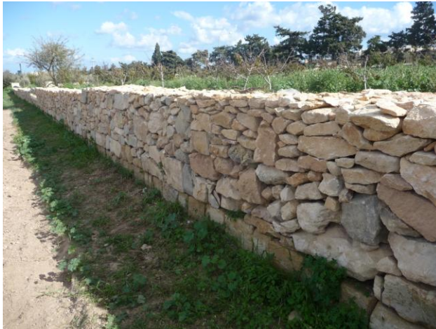
Ritratt 3. Hajt tas-sejjieh, tipiku mediterranju f' Malta. (Karrateristika tal-landscape protett).

Mezz ieħor dirett ta' kif timxi mal-problema hu li tkun aktar ħabib mal-ambjent billi thaddar il-landscape jew thaddar l-iskejj fejn tirreferi għall-disinn tal-landscape ekoloġiku u sostenibbli. Bħala eżempju, il-ġardinara għandhom jimplimentaw landscape aħdar fil-ġonna billi jsegwu passi importanti bħal dawk irrikmandati fil-fuljett relatat (2006) mahruġ riċentament minn EPA (Agenzija Ambjentali Ewropeja):