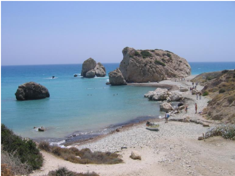
Ritratt 1. Marine-scape famuża: il-Ġebbla ta' Afrodite f'Pafos - Ċipru

Sfortunatament, minkejja l-individwalita u l-għarfien tal-landscapes mediterrani, il-maniġġ tagħhom hu tant il-bogħod mil-effettiv, bil-massa tat-turiżmu ġa jwassal għal deterjorazzjoni u f' hafna każijiet għal qerda kompluta bil-massa tat-turiżmu.