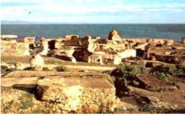
Resim 1. Antik Kartaca, Mare Nostrum Projesi [9].

Akdeniz eşsiz ve bir kez yıkıldı mı yenilenemeyecek miras alanlarıyla yaygın olmasına rağmen, çevresinde yaşayan yerel halk yüzyıllar boyunca onları göz ardı etmiş, yapı malzemesi olarak kullanmış, hatta hayvanları için ağıl olarak bile kullanmışlardır (De la Torre and Mac Lean, 1997).