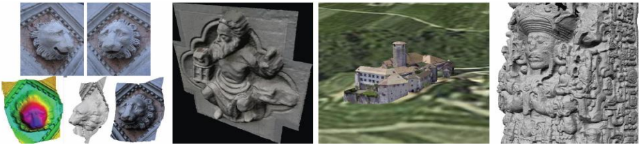
Resim 2. Miras alanları - koruma, restorasyon, eğitim ve görsel nedenler için-modelleme tekniği ile dijital imaj kullanılarak yeniden yaratıldı

Miras alanlarının daha iyi sunulması ve halka anlatılması ile ilgili ihtiyaç farkındalığı giderek artıyor. Ne yazık ki miras alanları kamuya sunumlarına bakıldığında çok fazla gelişmemiş, aslında 'ziyaretçi yükümlülüğü olarak görülen ve kabul edilen' yerler olmalıdır (De La Torre, 1997). Bu şekilde, ziyaretçiler sadece 'şaşkın turistler' olmak yerine miras alanlarının korunması ve araştırmalarının avukatı olacaklar. Bu nedenle gerekli olan: detaylı ve okuyucu dostu, iyi bilgilendirilmiş kılavuzlar, turistlerin kırılğan bölgelere gitmelerini önleyecek açıklayıcı panolar ve modern teknolojinin kullanımı ile hazırlanmış görsel metotlar. Çeşitli bilim adamlarının çalışmalarında da belirttikleri gibi miras alanlarının 3-D belgelerinin popülaritesi giderek artıyor ( Gruen ve arkadaşları, 2003, Remondino ve Rizzi, 2009). İnternet, bizim miras alanlarımızda fazla uygulanmayan önemli bir araçtır. Yerel fırsatların akademik enstitü programları ile paralel olarak birleştirilmesi iyi bir fikir olabilir (Nardi, 2010). Böylece yerel halka kendi bölgelerindeki miras alanlarıyla ilgili restorasyon ve koruma, belgeleme, kataloglama ve sunum ile ilgili uzman eğitimleri almaları için şans verilmiş olur.