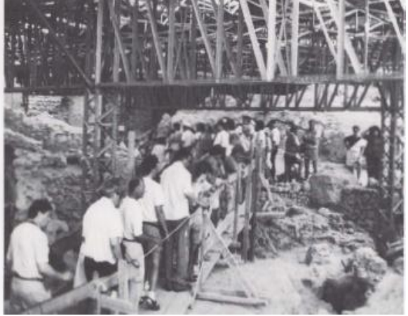
Resim 2. Akdeniz Bölgesi'nde Arkeolojik Alan Koruması (Doumas, 1997; in De la Torre, 1997).

Tourist-season visitor traffic. Thousands of visitors walk daily through the ruins under the metal roof in the heavy tourist season (April through November). Temporary walkways created to prevent damage to the monuments hamper both circulation of visitors and the guiding of large groups.