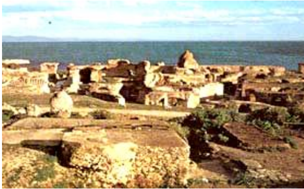
Ritratt 2. Ancient Carthage, Mare Nostrum Project (9).