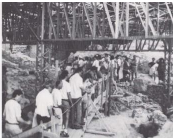
Ritratt 3. The Conservation of Archaeological Sites in the Mediterranean Region (Dumas, 1997; in De la Torre, 1997).

Tourist-season visitor traffic. Thousands of visitors walk daily through the ruins under the metal roof in the heavy tourist season (April through November). Temporary walkways created to prevent damage to the monuments hamper both circulation of visitors and the guiding of large groups.