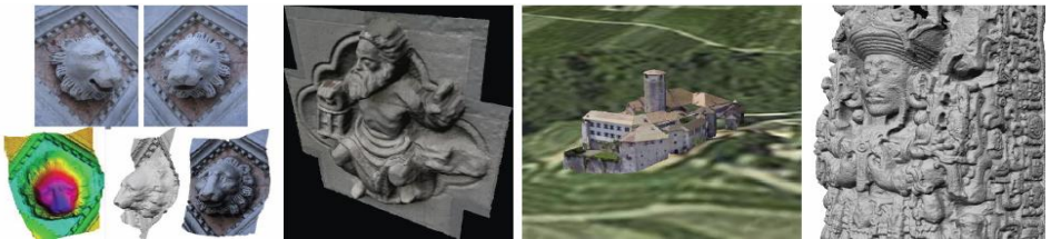
Ritratt 4. Heritages digitally reconstructed using image- or range-based modeling techniques for conservation, restoration, educational and visualization purposes, (Source: Remondino and Rizzi, 2009).

tagħhom lill-pubbliku, li suppost il-mistieden għandu jara' u jaččetta bħala obbligu (De La Torre, 1997). B'dan il-mod, il-mistiednin isiru l-advokati tar-riċerka u l-konservazzjoni tas-siti patrimonjali u mhux jibqgħu biss turisti li jistgħagħbu. Għalhekk, li hemm bżonn hu: kotba gwidi dettaljati u li huma ħfief li taqra, gwidi mgħarfa sew, bords li jfissru u li jigwidaw lil mistiednin sabiex jevitaw il-partijiet fraġli tas-siti, u l-metodi tal-viżwalizzazzjoni li jużaw b' mod eżatt it-teknoloġija moderna. Dokumentazzjoni 3-D tas-siti patrimonjali qegħdin iżidu li jkunu popolari bħalma x-xogħol ta' l-iskolari differenti jindikaw (Remondino and Rizzi, 2009; Gruen et al. 2003). L-internet hu għodda importanti, li ma tantx ikun implimentat għas-siti patrimonjali tagħna. Ideja tajba tista' tkun li l-opportunitajiet tal-lokal jkunu magħqudin b'mod parallel mal-programmi akademiċi istituzzjonali (Nardi, 2010), fejn jagħtu ċ-ċans lil poplu lokali sabiex jakwistaw taħriġ speċjalizzat relatat mar-restorazzjoni u konservazzjoni, dokumentazzjoni, ikattalgar u preżentazzjoni li huma konnessi mas-siti patrimonjali tal-preżent fiż-żoni tagħhom.