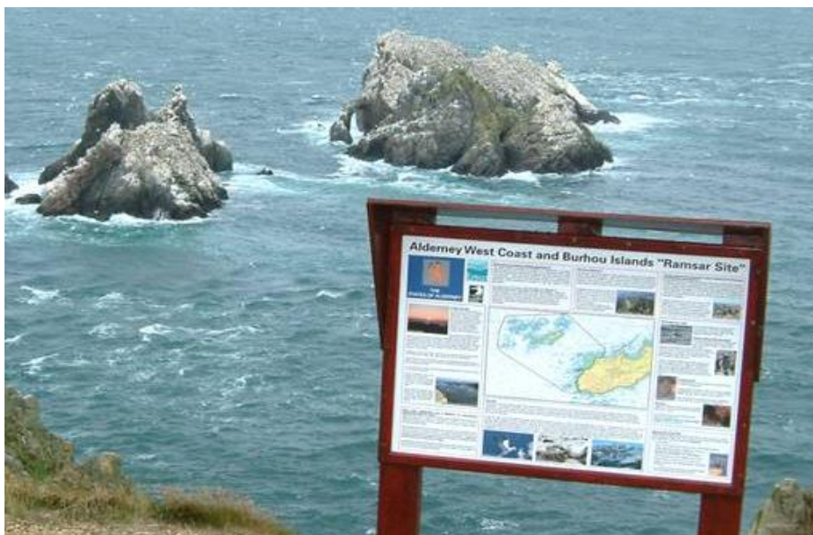
Stampa 5. Sinjali interattivi ta' informazzjoni (13)