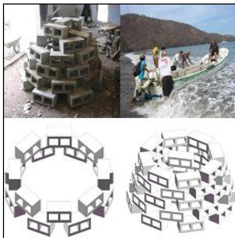
Stampa 2. Sikka żghira artifiċjali (8).