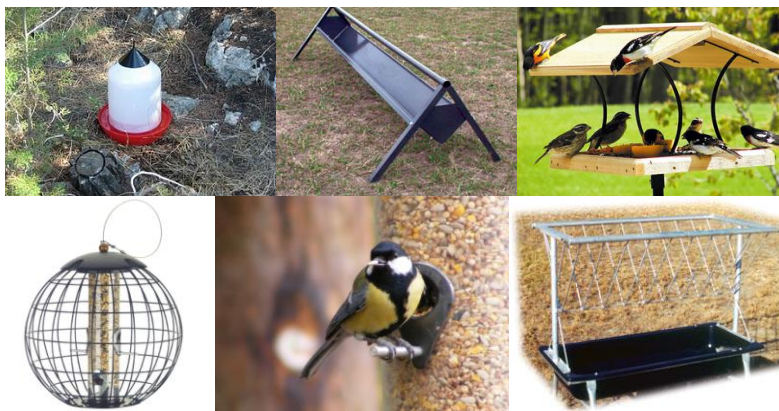
Stampa 4. Reċipjenti għall-ikel u l-ilma (11, 12)